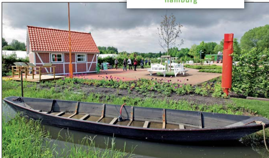
Marktplatz „Lebendige Kulturlandschaften“.