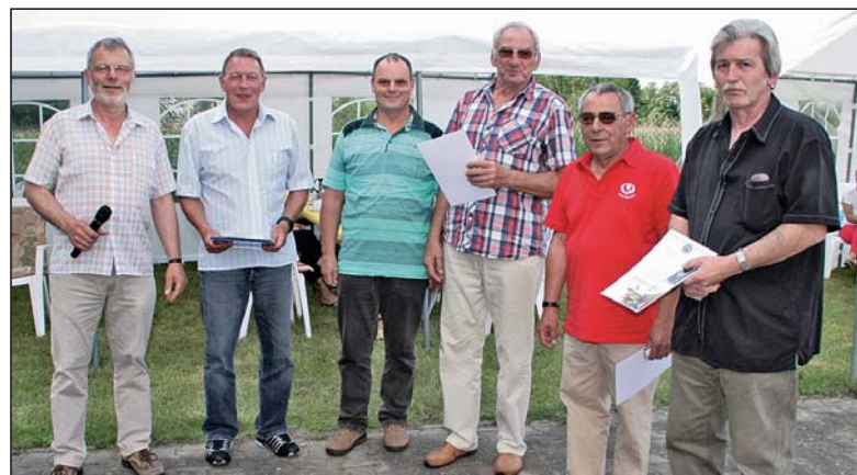
Die Auszeichnungsrunde mit der Ehrennadel des Kreisverbandes.

Die neu gegründete Kleingartenanlage erhielt, dem damaligen Zeitgeist entsprechend, den Namen „Deutsch-Sowjetische-Freundschaft“. Organisatorisch wurde sie dem Kreisverband Luckenwalde des VKSK angegliedert.