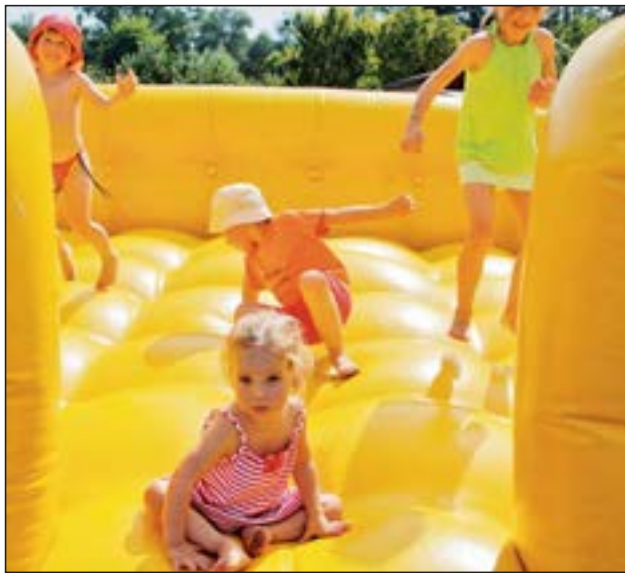
Die Hüpfburg war „bevölkert“.

Gestartet haben die „Süd-Westler“ am 18. August jedoch erst einmal mit einer ordentlichen Mitgliederversammlung. Viel Lob fand in der Bilanz ihren Niederschlag. Doch auch mit sehr deutlichen, mahnenden Worten sparte der