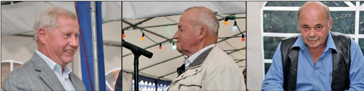
Die drei Höchstgeehrten und das Herthasee-Team.